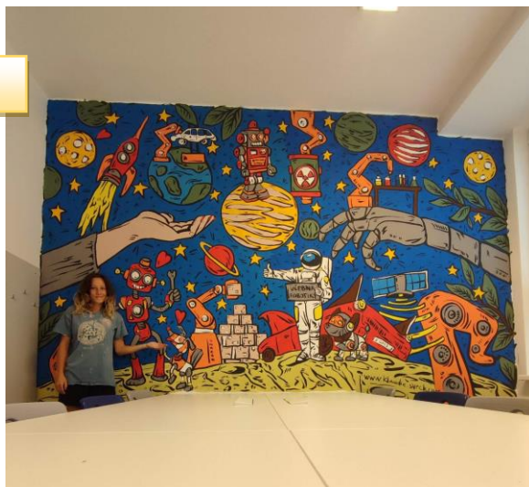
Naše nová zeď

Učebna informatiky a robotiky – v rekonstruované učebně jsou umístěny robotické pomůcky, notebooky pro žáky a i-pady na ovládání robotů a pro výukové aktivity. Ve školním roce jsme vybavili učebnu dvěma 3D tiskárnami a ve spolupráci s výtvarnicí Klaudíí Švrčkovou byla provedena malba na zdi ve stylu „svět robotů“